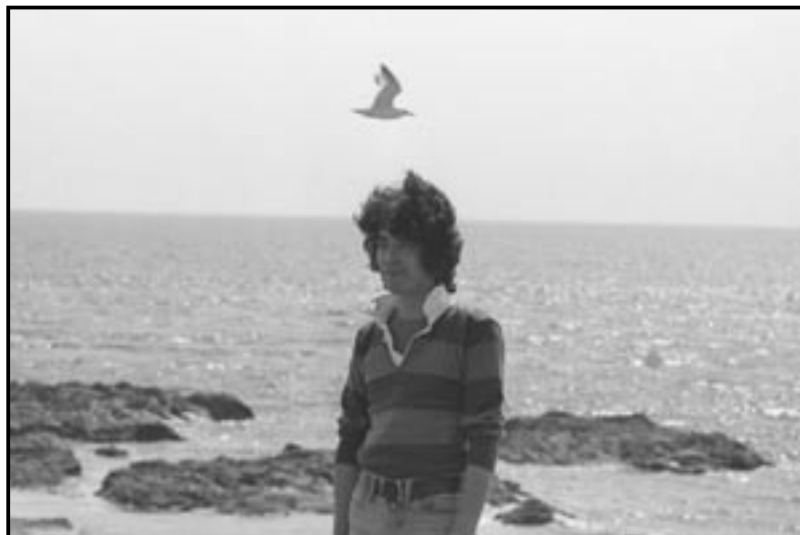
制作 アートワークス