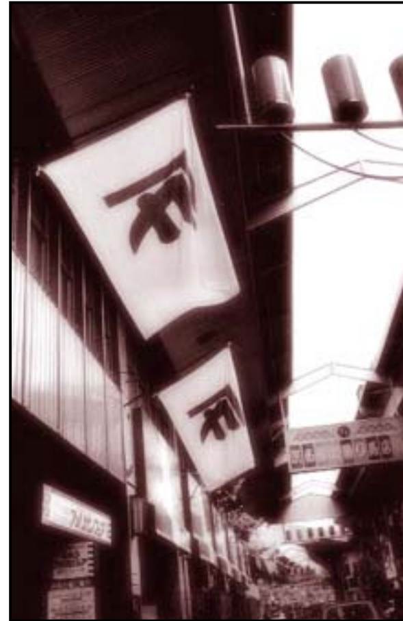
アーケード 岡政デパート