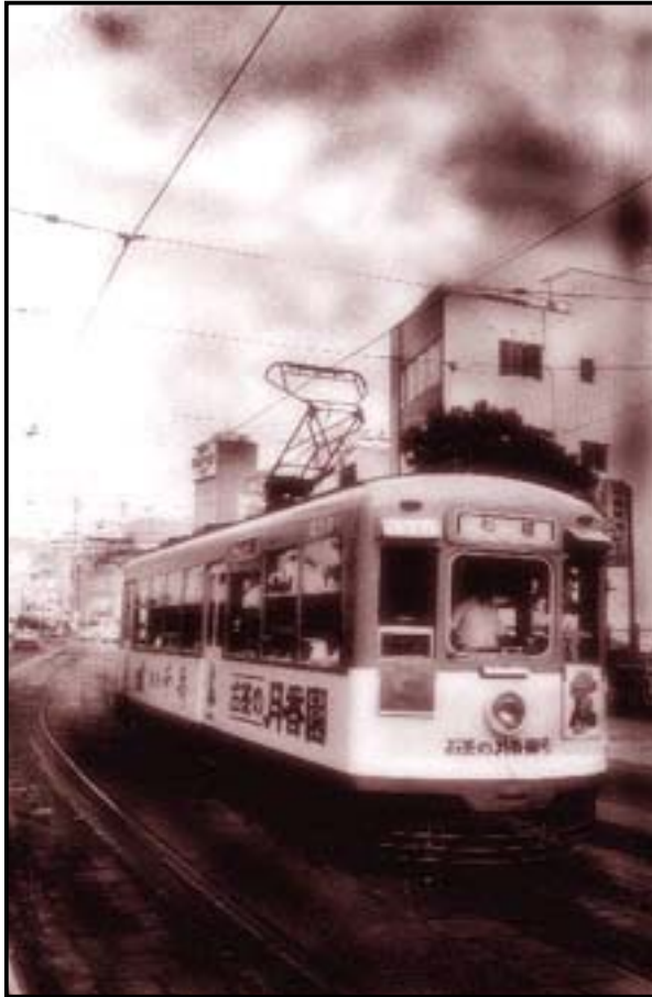
石橋行きの市内電車