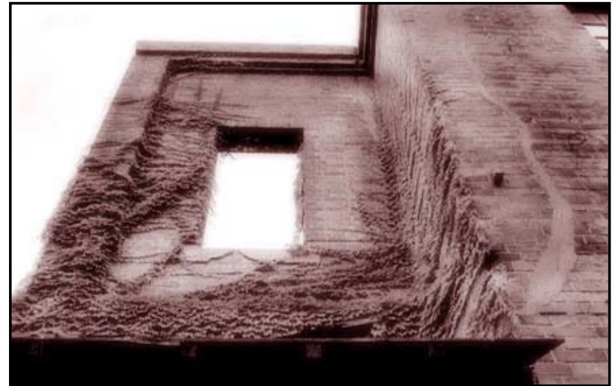
長崎港旭町付近 レンガ造りの朽ちた建物