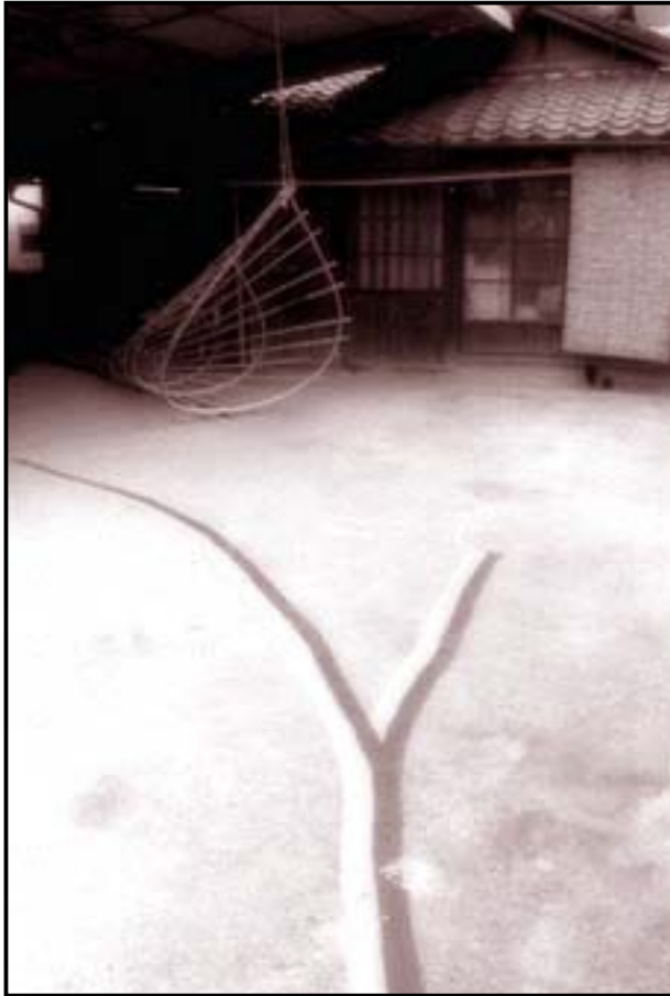
精霊流しの準備をしている家