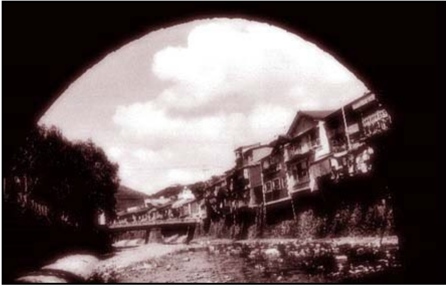
眼鏡橋下から見た中島川の家