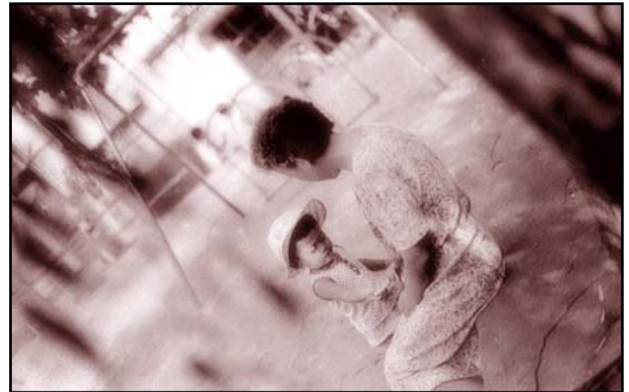
中島川沿いにある公園